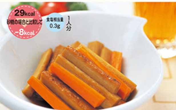
糖尿病食事療法のための食品交換表 第7版